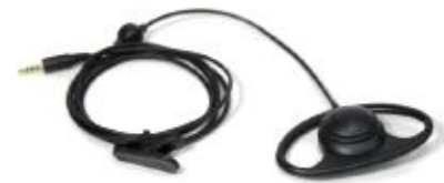
Kopfhörer (Der Klinenstecker muss 3,5mm, 4-polig vom US-Typ sein)